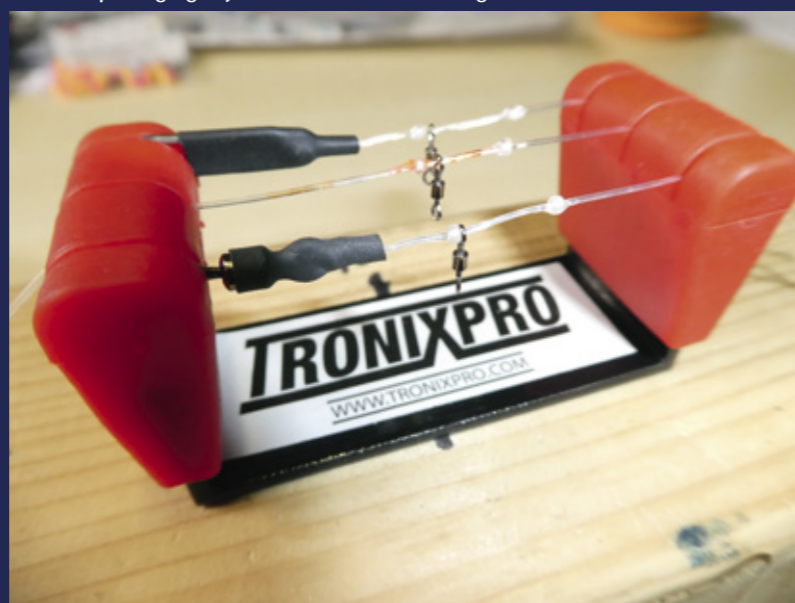
De Tronixpro Rig-Jig blijkt een welkome aanvulling.

Sluit ik af met mijn laatste aankoop. En nu begeef ik mij een beetje op glad ijs... We weten immers allemaal dat we eigenlijk volledig voor loodvrij zouden moeten gaan, maar deze variant van lood is er (nog) niet in loodvrij. Is eigenlijk geen excuus,