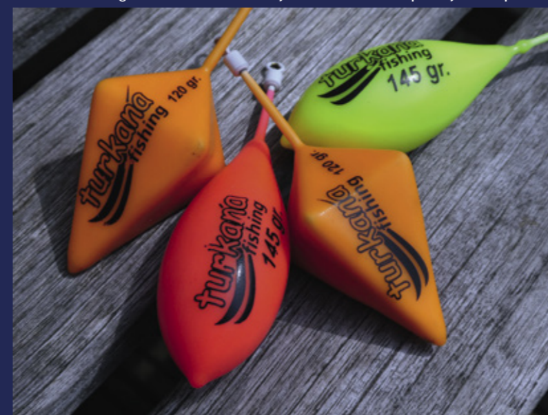
Even een boost geven met de flitser van je camera of de lamp van je smartphone en dit lood wordt onder water een spotlight!