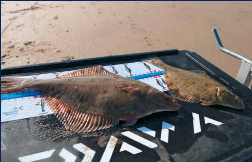
Heus, die twee botjes komen vers uit zee!