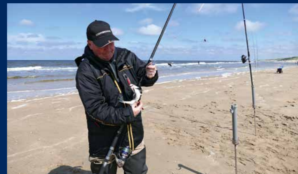
"Ik weet in de regel wel m'n visje te vangen, maar ben voor de top duidelijk niet fanatiek genoeg!"