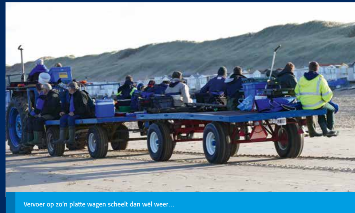
Vervoer op zo'n platte wagen scheelt dan wél weer...

Fish Heiloo organiseert er een paar per jaar en Nipro Hengelsport uit St. Maarten doet dat ook. Bij die lokale onderonsjes heb je kans om mij te treffen. Waarom zo weinig? Ten eerste: ik ben gewoon niet goed, niet fanatiek, genoeg om mij volledig op het wedstrijdvisserij te werpen. Dat vergt namelijk heel veel voorbereiding, heel veel trainen en heel veel kennis van wat er op dit moment allemaal hot is in de wedstrijdvisserij. Als ik mee doe met een grote wedstrijd, vind ik het fantastisch om foto's te maken en om een praatje te