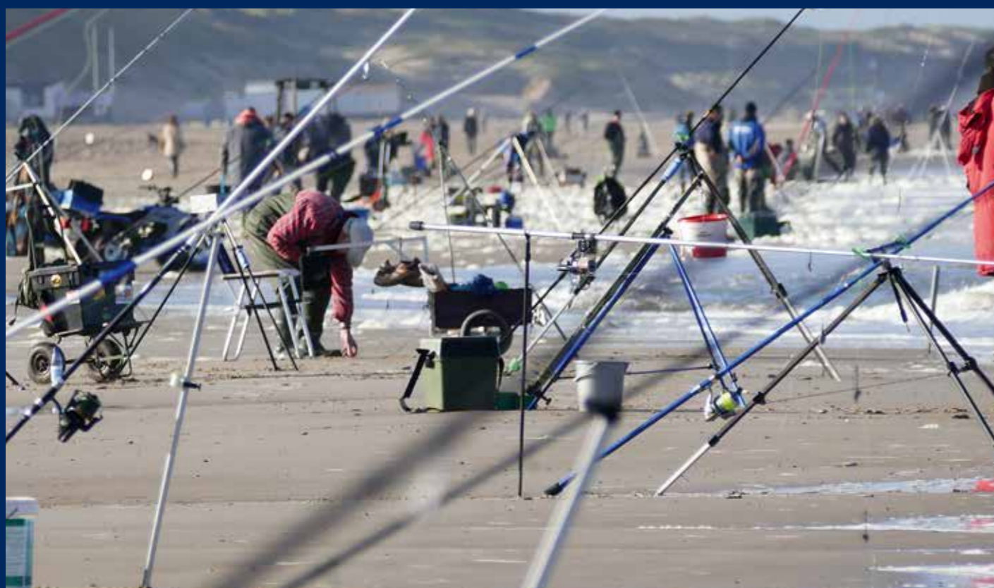
Langs de gehele kust van onze Lage Landen worden in 'het seizoen' grote wedstrijden georganiseerd met 100 en meer deelnemers.

Ik had het waarschijnlijk getroffen met mijn plaatsnummer –zegt hij